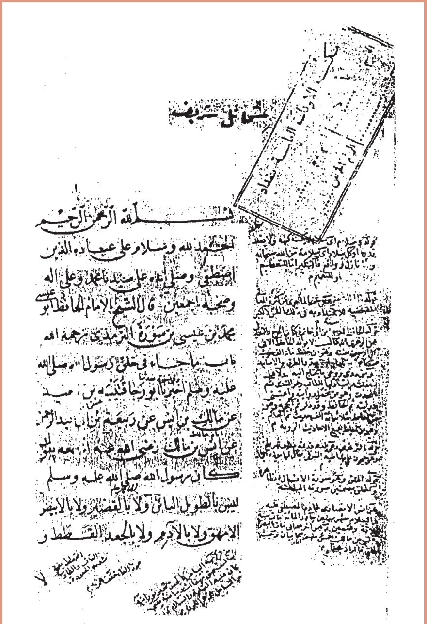
راموز الورقة الأولى من نسخة «د»