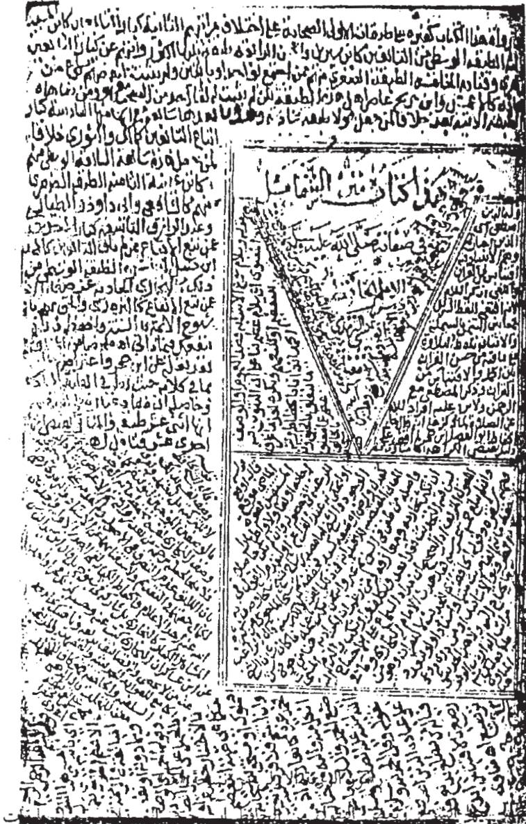
راموز الورقة الأولى من نسخة «هـ»

ويظهر فيها الشرح وبعض النقول من الحافظ ابن حجر حول طبقات الرواة